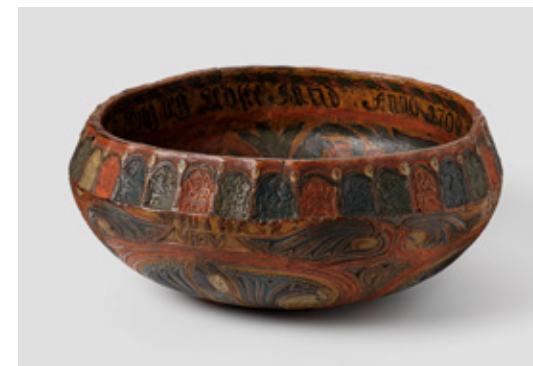
01. ØLBOLLE Tarjei Tarjeisson Berg (sannsynlig), 1799. Nasjonalmuseets samling.