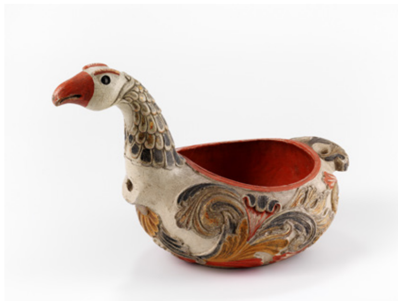
03. ØLBOLLE MED HANK Nasjonalmuseets samling. Tidlig 1800-tall.